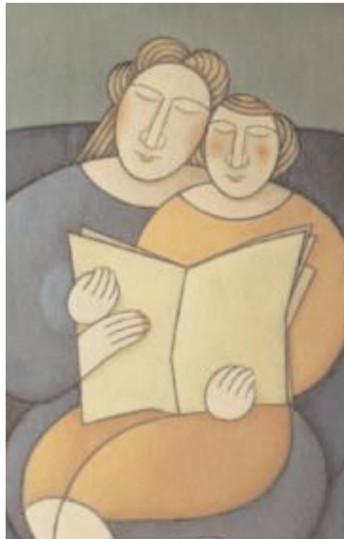
Fragmento de Madre e hija leyendo , óleo sobre lienzo de Jacoba

Hemos constatado que una buena cantidad de escuelas han colocado sus libros en las aulas y empiezan a usarlos libremente los alumnos y/o en algunos casos con los maestros en todos los niveles. Sabemos que el tema del espacio no es el mayor impedimento; una gran cantidad de escuelas de diversos estados y en diferentes niveles han logrado habilitar ya algún espacio para la biblioteca escolar, en general ligados a los proyectos de escuelas de calidad o con apoyos gestionados con la comunidad; pero, como te decía antes, la encuesta nos permitirá precisar con qué frecuencia se usan y cómo se usan.