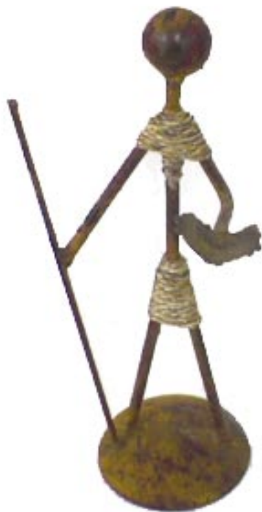
El guerrero ilustrado. Artesanía de Morelos

Aunque mi pasión por los libros se ha hecho cada vez menos compulsiva, aún hoy me es difícil imaginar un placer más completo que la lectura. Los libros siempre han estado cerca de mí como una promesa, una puerta o un cofre. He vivido rodeado de libros toda la vida. Me es difícil imaginarme sin ellos y desconfío de una casa en la que no los haya.